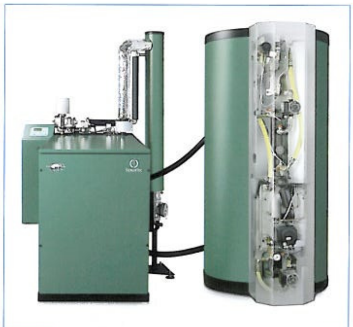
Abb. 1 Mit effizienter Kraft-Wärme-Kopplung trotz der Dachs den steigenden Strompreisen und versorgt Gebäude kostengünstig mit Strom, Wärme und Warmwasser.

Die thermische Leistung des Mini-BHKW reicht aus, um bei rund 6.000 Betriebsstunden jährlich etwa 60 Prozent des Heiz-