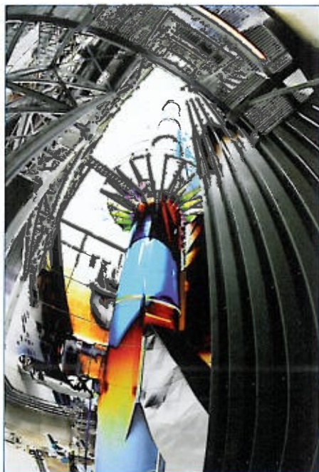
Abb. 3 Blick in das Kesselhaus des IHKW Andernach

Investor geregelt sind, ist elementar, damit über die gesamte Betriebsdauer der Anlage die Partner das gemeinschaftliche Interesse, kalkulierbare und günstige