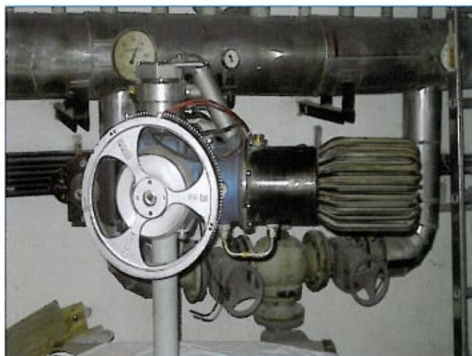
Abb. 3: Stirlingmotor