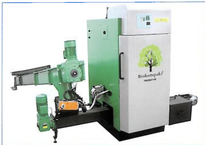
Abb. 1: Biomassekessel, Quelle: BIOKOMPAKT GmbH

vernachlässigenden Leistungsabfall des Stirlingmotors und damit direkt verbunden zu einem erhöhten Wartungsaufwand. Um dem entgegenzuwirken, wurde von Projektpartner ItN Nanovation AG eine auf Nanotechnologie beruhende Beschichtung für den Erhitzerkopf entwickelt, welche in der Lage ist, die Verschlackung des Erhitzerkopfs ganz oder zumindest in erheblichem Maße zu reduzieren. Dadurch werden entsprechend lange Wartungsintervalle und damit verbunden geringe Betriebskosten erreicht. Der Heizkessel speist die komplette Wärme in einen entsprechend dimensionierten Pufferspeicher ein. Dieser Pufferspeicher bedient dann wahlweise die Absorptionskältemaschine oder die angeschlossene Heizkreise (siehe Abb. 4). NANOSTIR entspricht einer Technologiekombination, welche in variablen Anteilen