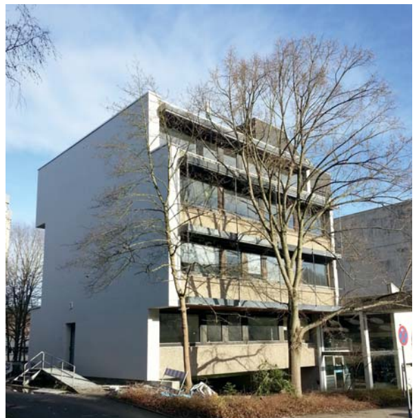
Bild 2: Fassade im Ausgangszustand (oben links), Fas- sade mit Kapillar- rohrmatten der Wandtemper- erierung (oben rechts), Einputzen der Matten (Mitte links), Aufkleben der Wärmedäm- mung (Mitte rechts), Armierung (unten links) und Fassade im sanierten Zustand (unten rechts)